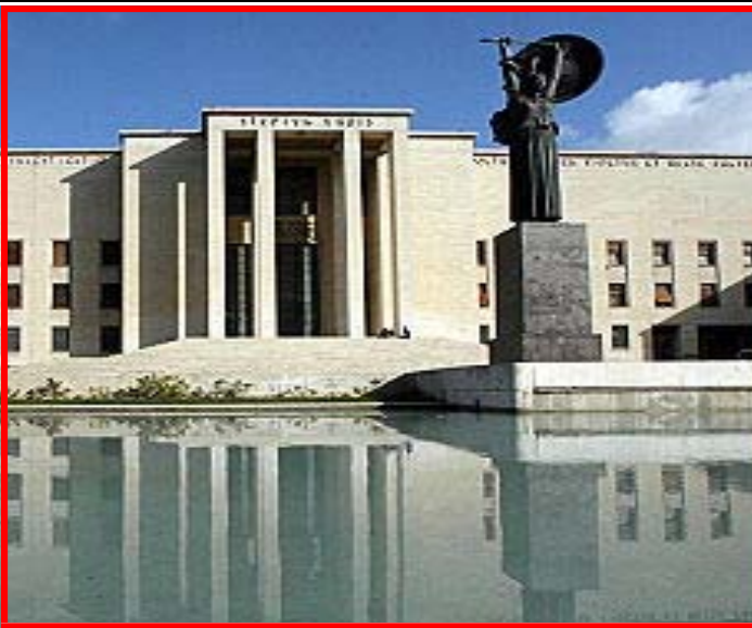
L'università La Sapienza di Roma