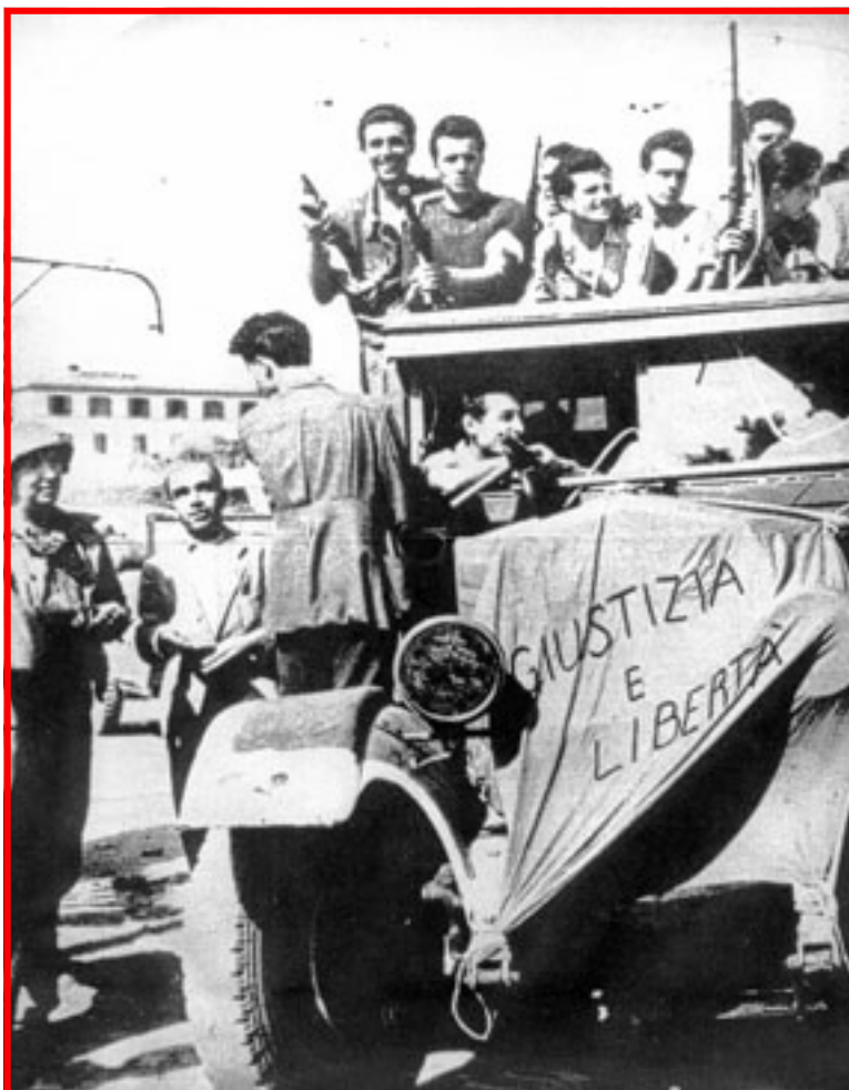
Dopo la sconfitta di un altro «Cavaliere» eccoci alla Liberazione di Roma: un camio dei partigiani di Giustizia e Libertà.