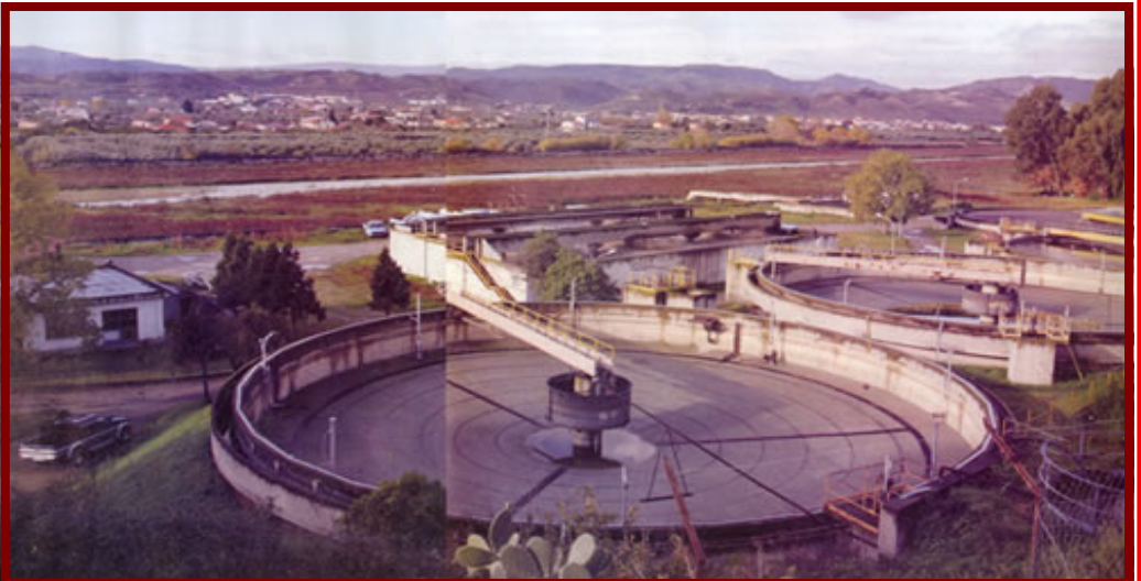
Un depuratore calabrese

Il ragazzo non guarda in faccia nessuno.