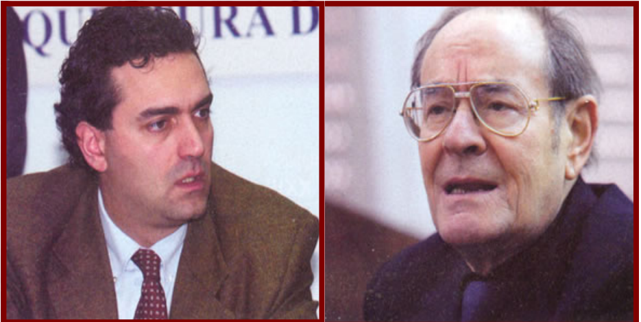
A sinistra, il sostituto procuratore Luigi De Magistris; a destra, il Procuratore Capo della Repubblica di Catanzaro: Mariano Lombardi.

È stato consigliere d'amministrazione dell'Anas e responsabile unico per l'emergenza ambientale in Calabria. Nella sua abitazione romana gli uomini mandati da De Magistris scoprono un mucchio di roba interessante: oggetti di valore, i documenti di trasporto di una partita di diamanti e libretti d'assegno di molti conti italiani ed esteri, uno dei quali intestato al partito Alleanza nazionale; poi un grembiolino massonico e un biglietto da visita (con numeri di telefono riservati aggiunti a mano) del generale della Guardia di finanza Walter Cretella Lombardo , comandante del Secondo Reparto, ossia il servizio segreto interno alla Guardia di finanza; infine alcuni dossier spionistici, con intercettazioni telefoniche illegali di conversazioni avvenute nel