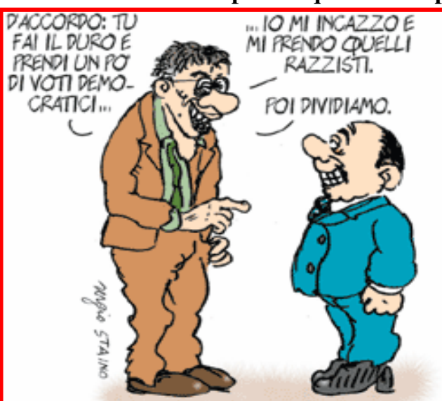
Vignetta di Staino, tratta da l'Unità 20.02.2006

Lo ha detto Francesco Rutelli, leader della Margherita.