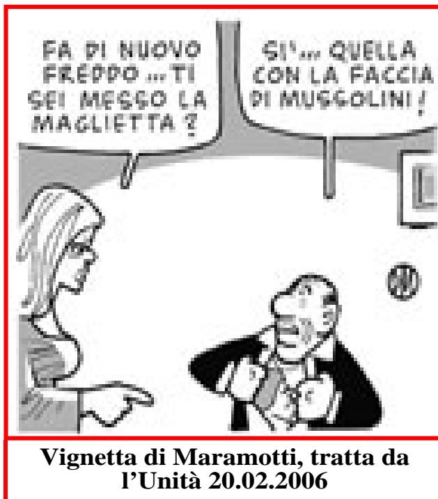
Vignetta di Maramotti, tratta da l'Unità 20.02.2006

Lo ha detto Gianfranco Fini ai cronisti, al termine di un incontro alla moschea di Forte Antenne, rendendo noto di aver sentito ieri sera per telefo-