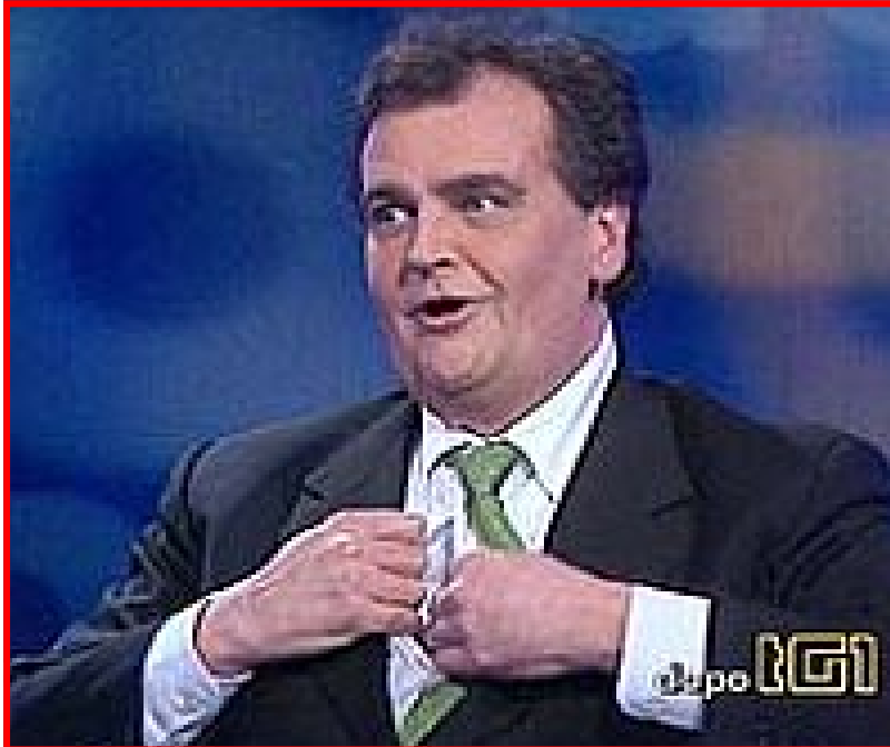
Calderoli mostra la "T-shirt" con la vignetta blasfema

sa, ecc.) culminati con l'uccisione del sacerdote e il massacro di suore e civili, colpevoli solo di professare una religione diversa dall'Islam".