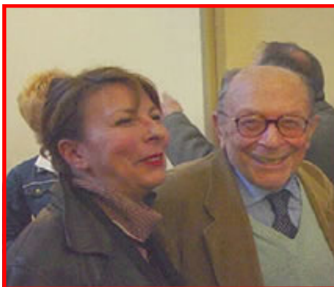
Il prof. Paolo Sylos Labini

Severo nei giudizi, la sua indignazione era grande e la esprimeva con forza, sostenendo la necessità della durezza e dell'intransigenza della critica soprattutto quando si trattava di difendere la legalità e la democrazia.