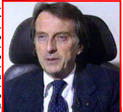
2005 - Luca Cordero di Montezemolo, presidente della Fiat e della Confindustria.

Roberto Maroni: «Non conosco Ricucci. Non abbiamo interessi diretti in questa vicenda, ma mi pare che ci sia uno scatenarsi, pregiudizialmente ostile, di una serie di dichiarazioni contro di lui che fanno ricordare il trattamento ricevuto e che ancora riceve la Lega in certi ambienti. Per questo, e solo per questo, Ricucci mi è diventato simpatico».