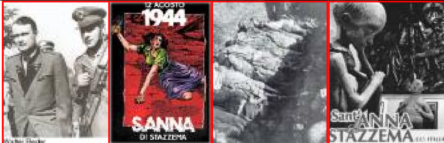
Immagini di Marzabotto, S. Anna di Stazzema,