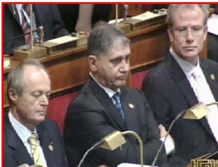
Rocco Buttiglione alla firma della Costituzione Europea (Roma 2004.10.29), dalla sua espressione si intuisce che era già a conoscenza di essere stato silurato non solo da Barroso, ma persino dal cav.

Per lui l'universo-Dio era un grande cacio, e l'umanità erano i vermi. Allo stesso modo ogni volta che parla di Dio, Buttiglione non si avvicina all'Assoluto ma al proprio formaggio, che è fatto di eterosessuali ad excludendum, di casa-