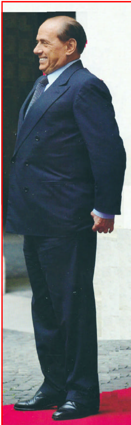
Il cav. in una splendida fotografia, di Diario (copertina del n° 24, del 24 giugno 2004)

Ciò che si è irrimediabilmente sfaldato, infatti, è il principio politico d'autorità, la capacità di leadership del Cavalie-