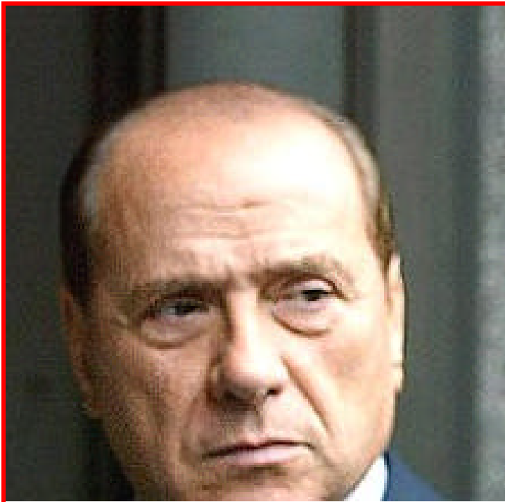
Dopo il 12-13 giugno scorso, Mr. President mostra di aver bisogno di un nuovo "lifting"

Emblematica la sua risposta ad Enrico Mentana che, in seguito alla liberazione degli ostaggi, gli ha chiesto se avrebbe rilasciato interviste una volta sceso dall'aereo che lo portava negli Stati Uniti: "Sono sempre a vostra disposizione ". Proprio lui che ama farsi desiderare dalla stampa, proprio lui