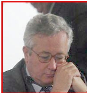
Il ministro Giulio Tremonti

detto apertamente che il Caso Tremonti è «Un caso unico in Occidente» , che le sue sono «Decisioni che prevaricano il Parlamento»