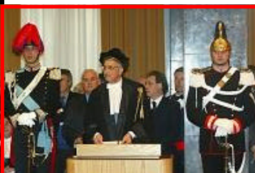
L'inaugurazione dell'anno giudiziario alla Corte dei Conti (2004)

Ossia, un buon due terzi della riforma della scuola viene colpito al cuore. Tale legge, infatti per la Consulta «viola le competenze degli enti locali» in base al nuovo titolo V della Costituzione.