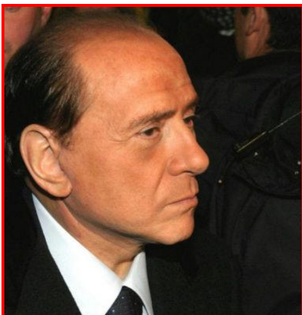
Dopo il "restyling"