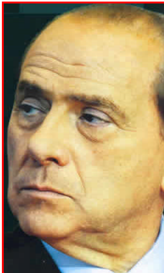
Prima del "restyling"

«Berlusconi ha nuovamente constatato questa settimana, con costernazione, che il sistema italiano di checks and balances è tuttora funzionante. Tenendo fede al principio dell'uguaglianza davanti alla legge, la Corte costituzionale ha appena bocciato la recente legge che assicura al primo ministro l'immunità nell'esercizio del suo mandato»,