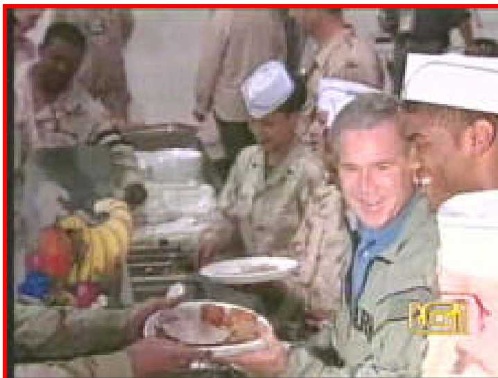
Uno spericolatissimo viaggio di George W. Bush. Il viaggio, per il "Tanksgiving Day" è durato ben 27 ore, di cui 3 trascorse a Baghdad, a scopo unicamente elettorale nel campo americano per mangiare il tacchino con i "suoi" soldati.

Di tutte queste malefatte politiche e di quelle ancor più vistose del Premier Berlusconi siamo stati costretti a parlare continuamente sulle pagine di questo giornale e non vorrò dilungarmi ancora adesso; ma serve sottolineare che questo modo di fare politica, questo modo di amministrare i cittadini è saldamente legato a quel modello di sviluppo che mostrando i muscoli mette a tacere la Democrazia, che proiettato internazionalmente interviene con i soldati, che i morti di Nassiriya li ha sulla coscienza, che parla di pace e va a fare la guerra.